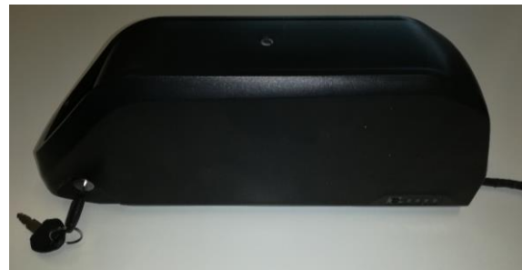
AureusDrive Batterie 1200Wh