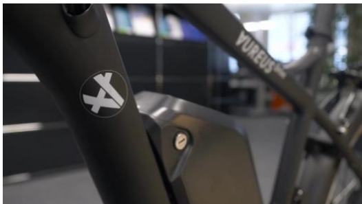
Batterie am Power45 montiert